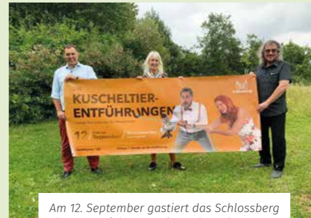
Am 12. September gastiert das Schlossberg Theater auf dem Martin-Luther-Platz.