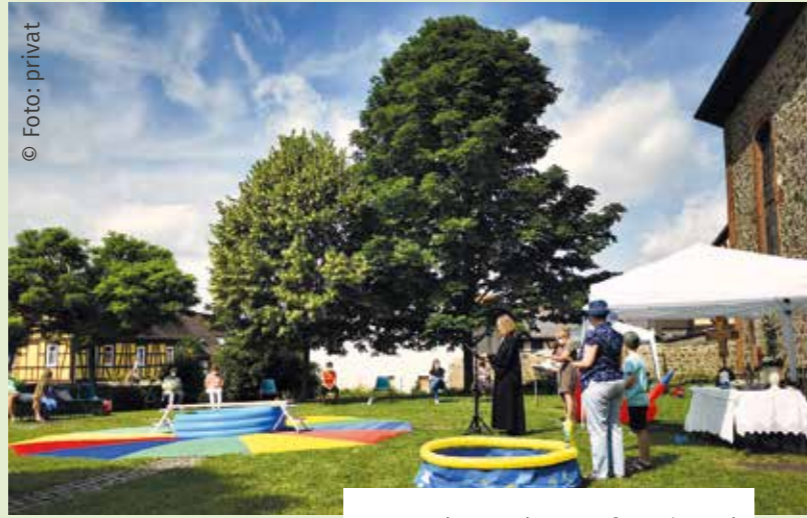
Impressionen einer Taufe Ende Juni