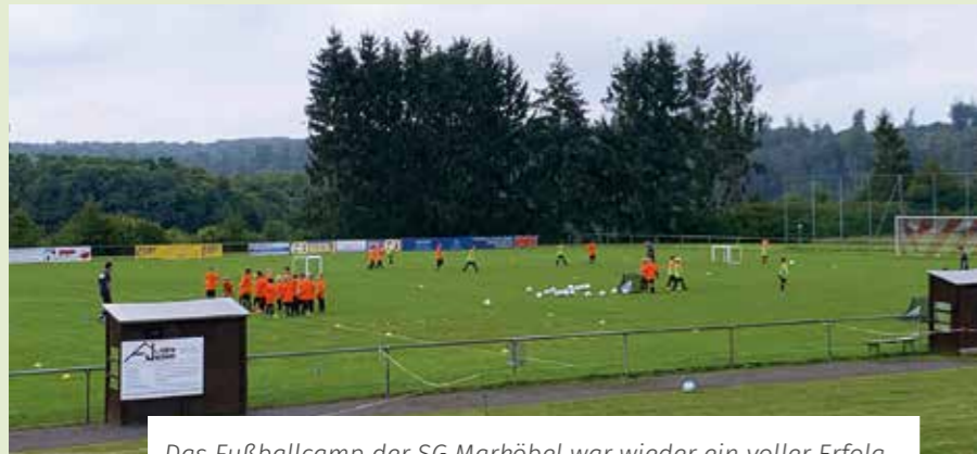
Das Fußballcamp der SG Marköbel war wieder ein voller Erfolg.