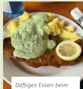
Deftiges Essen beim Hessischen Abend des KSV Langenbergheim