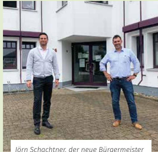
Jörn Schachtner, der neue Bürgermeister von Neuberg beim Antrittsbesuch.